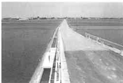
進む赤丸地区用排水路改修工事（赤丸地内）

終わりになりますが、皆様方の益々のご健勝、ご多幸をご祈念申し上げご挨拶といたします。