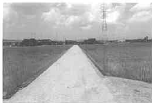
進む江尻地区ほ場整備工事（江尻地内）