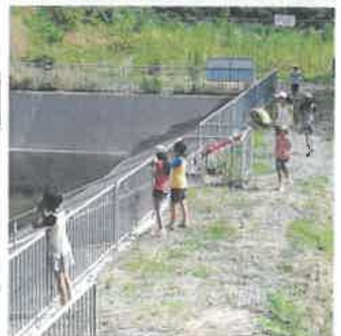
第10回「フィルムで秀す『農業用水』と暮らし」写真コンテスト作品の様子