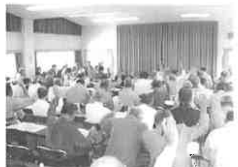
平成21年度決算ほかを審議した臨時総代会

提出議案は、予算関係では平成21年度事業報告及び収支決算について7件、平成22年度補正予算について2件が提案された。また、規約の一部改正の議決について審議をなされ、それぞれ原案どおり議決し終了しました。