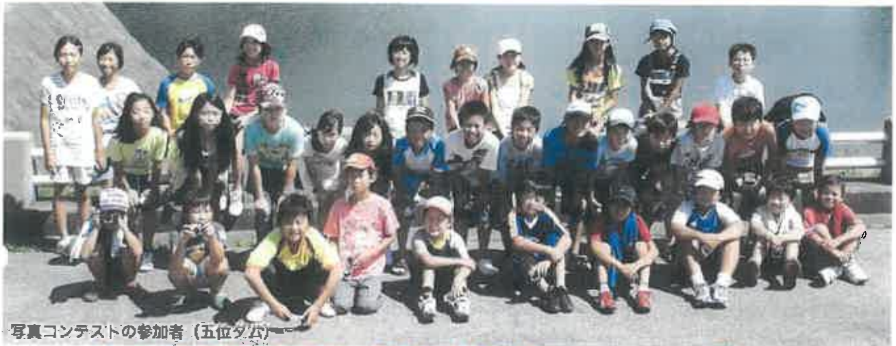
写真コンテストの参加者（五位タム）