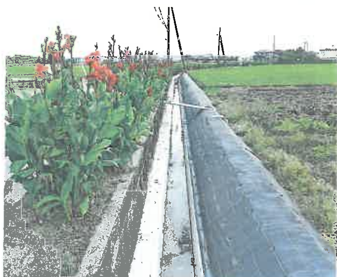
進む農地整備事業「土屋・鳥倉地区」