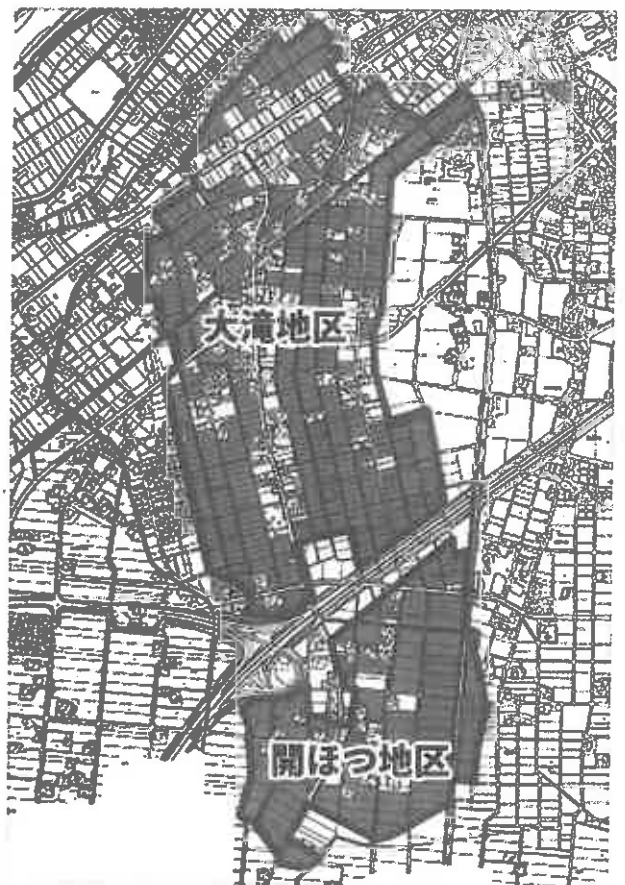
大滝・開ほつ地区区域図