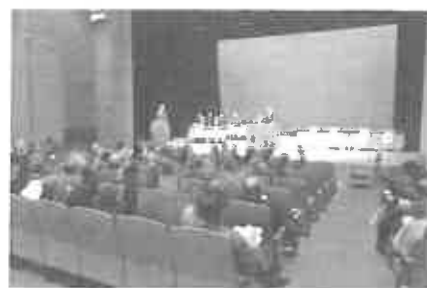
平成31年度予算ほかを審議した。