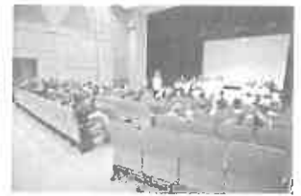
平成30年度事業報告、各決算ほかを審議した。