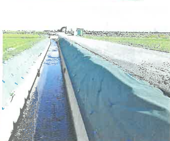
進む農地整備事業「石堤地区」