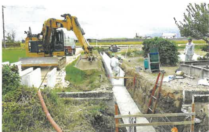
進む農地整備事業「土屋・鳥倉地区」