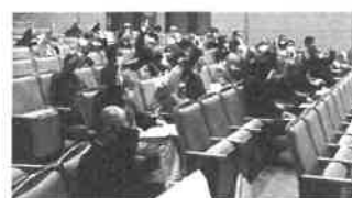
令和2年度事業報告、各決算ほかを審議した。