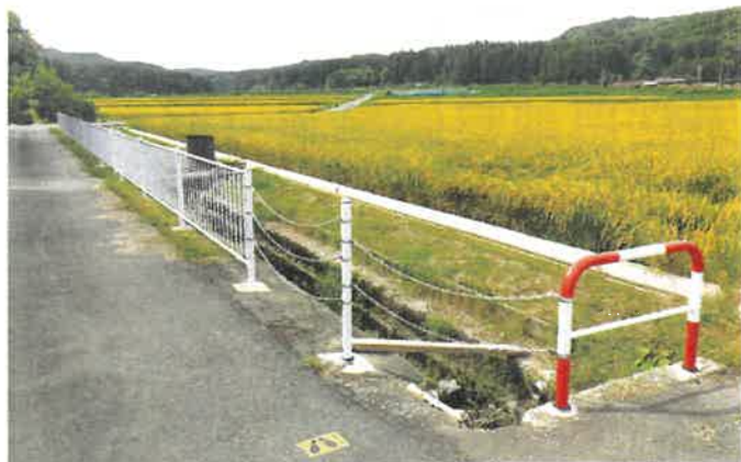
八口地内で設置された転落防止柵