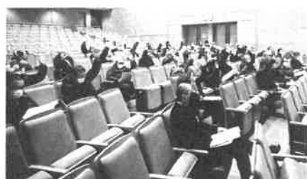
令和3年度予算ほかを審議した。