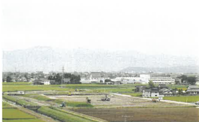
進む農地中間管理機構関連農地整備事業「開ほつ地区」