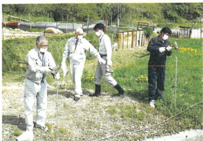
春の農業用水路危険箇所一斉点検