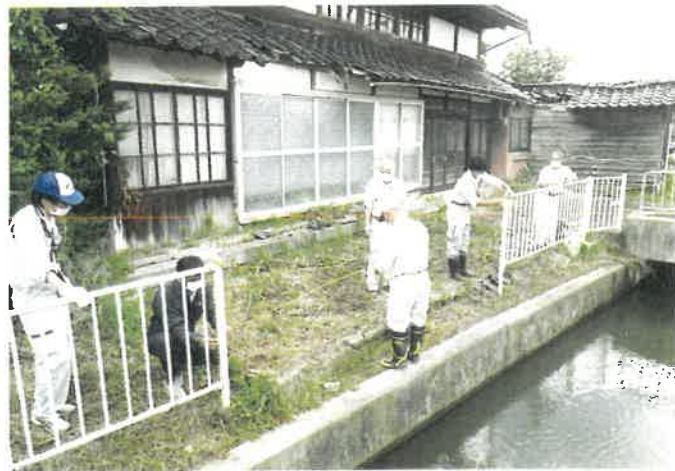
秋の農業用水路危険箇所一斉点検