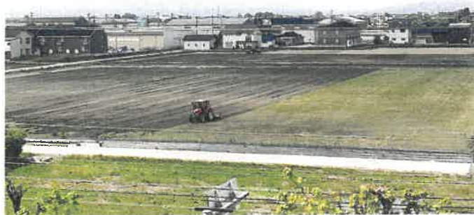
大区画化された農地「大滝地内」