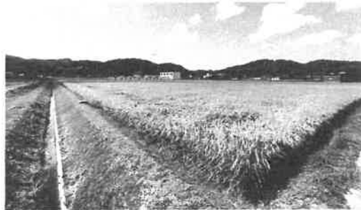
畦畔除去された田に棚引く稲穂