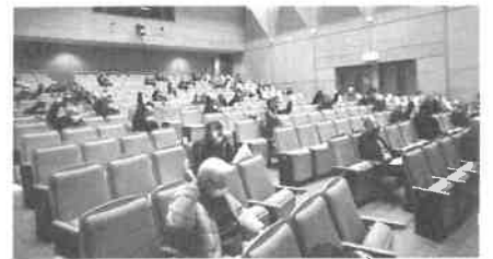
令和4年度予算ほかを審議した。