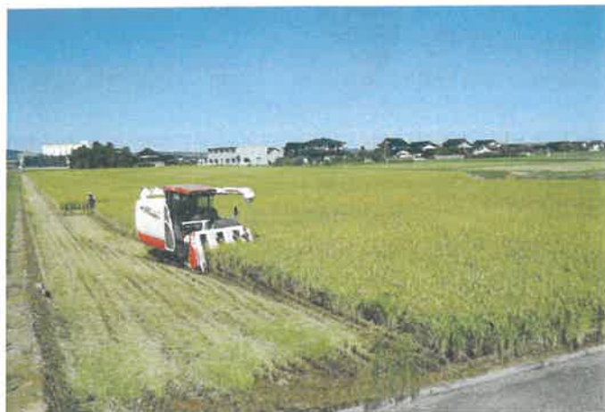
大区画化した農地での刈り取り作業（開ほつ地区）