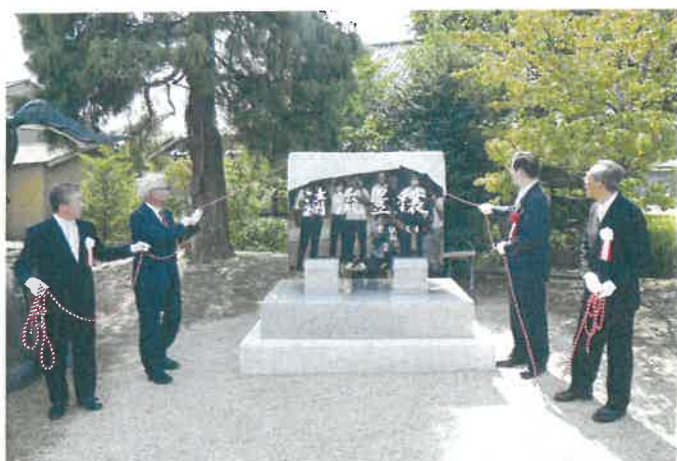
県営農地整備事業（経営体育成型）土屋・鳥倉地区完工