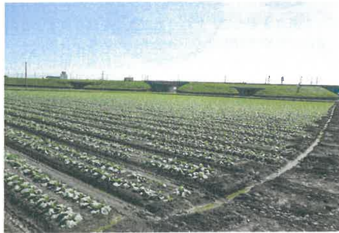
大区画化した農地での高収益作物の取組み（大滝地区）