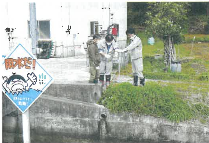
春の農業用水路危険箇所一斉点検