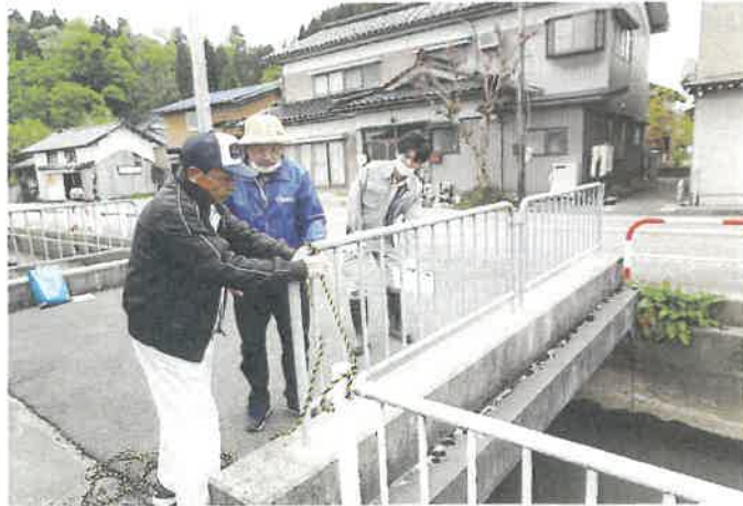
春の農業用水路危険箇所一斉点検