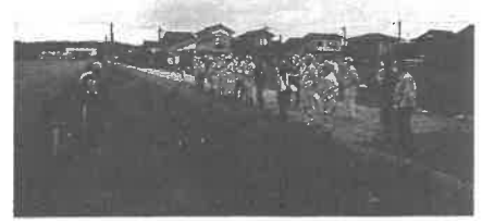
「大滝地区」自動水門説明