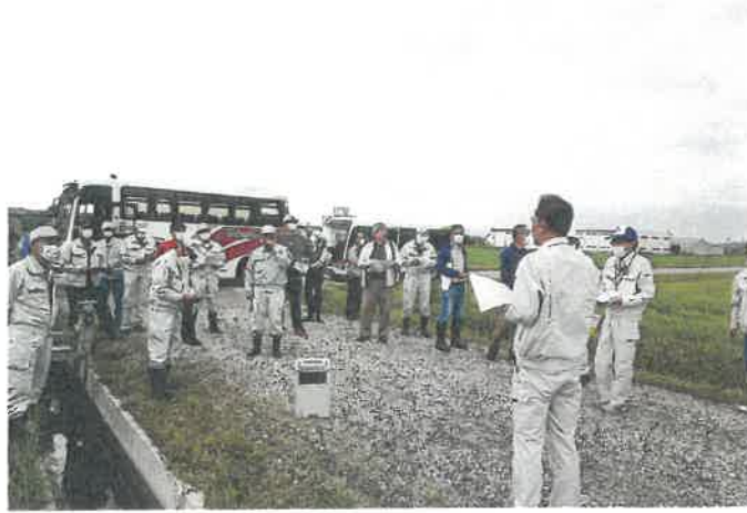
福岡町土地改良区総代・役員管内事業視察研修会