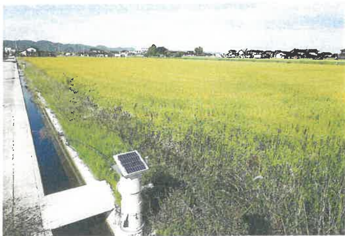
大区画化した農地に設置された自動給水栓(大滝地区)