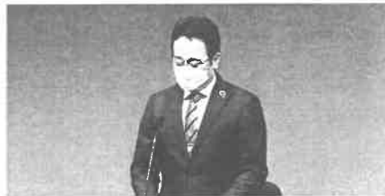
式庄高岡市産業振興部長挨拶