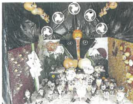
福岡の博多どんたく