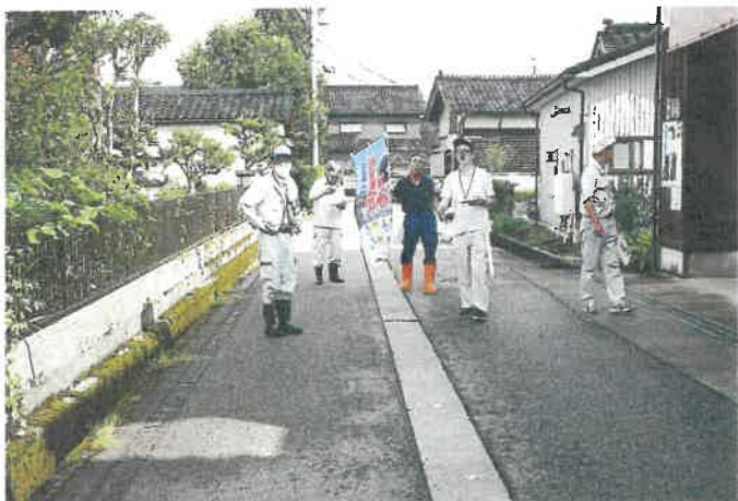
農業用水路安全対策ワークショップ「鳥倉地区」