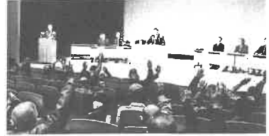
令和4年度事業報告、各決算ほかを審議した