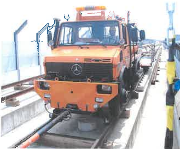
平成27年開業を目指して進む北陸新幹線 レール敷設工事(菟島地内)