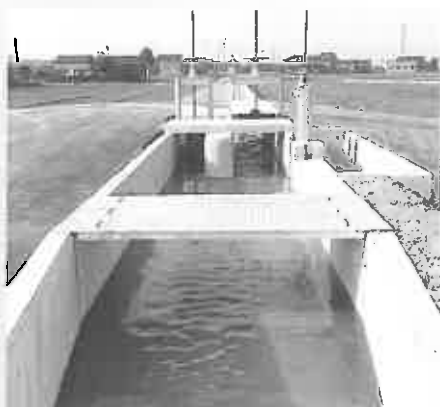
進む一步老子用水工事（一步二歩地内）