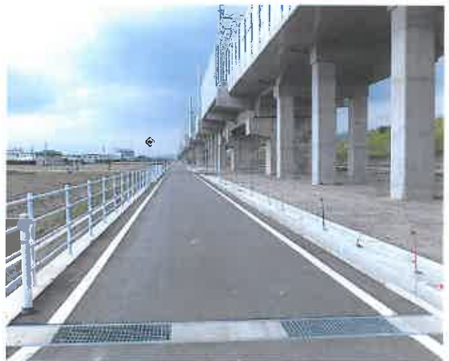
北陸新幹線建設福岡地区 関連道水路工事(江尻地内)