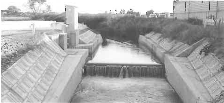
新しく整備された一步老子用水取水堰（一級河川荒又川 西川原島地内）